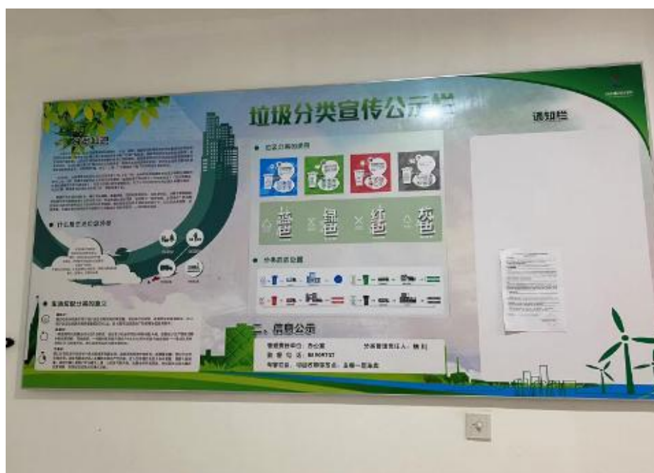
台州湾新区管委会