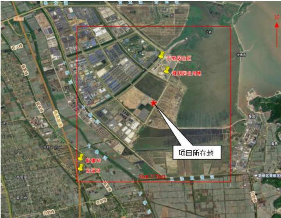
图 1 评价范围内敏感点分布图